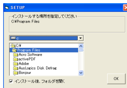
図 2- 2 「SETUP」画面

＜注意＞インストール後、インストールしたファイルやフォルダを移動すると、プログラムが正常に作動しなくなるおそれがあります。