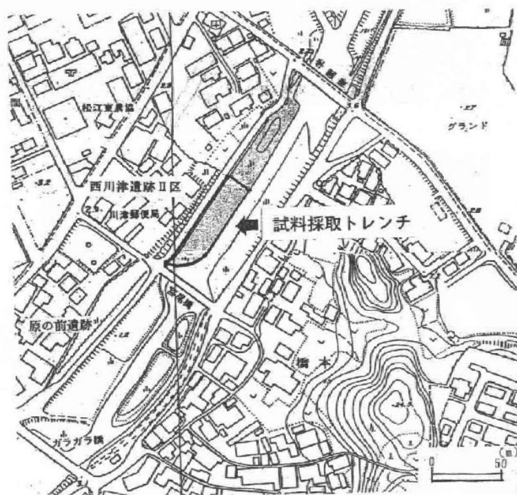
第158図 試料採取トレンチ位置図

第158図に示す調査トレンチのほぼ中央で試料を採取した。試料採取地点の柱状図を第159図の花 粉ダイアグラム中の左端に示す。また試料採取層準を、柱状図右に試料番号として示した。