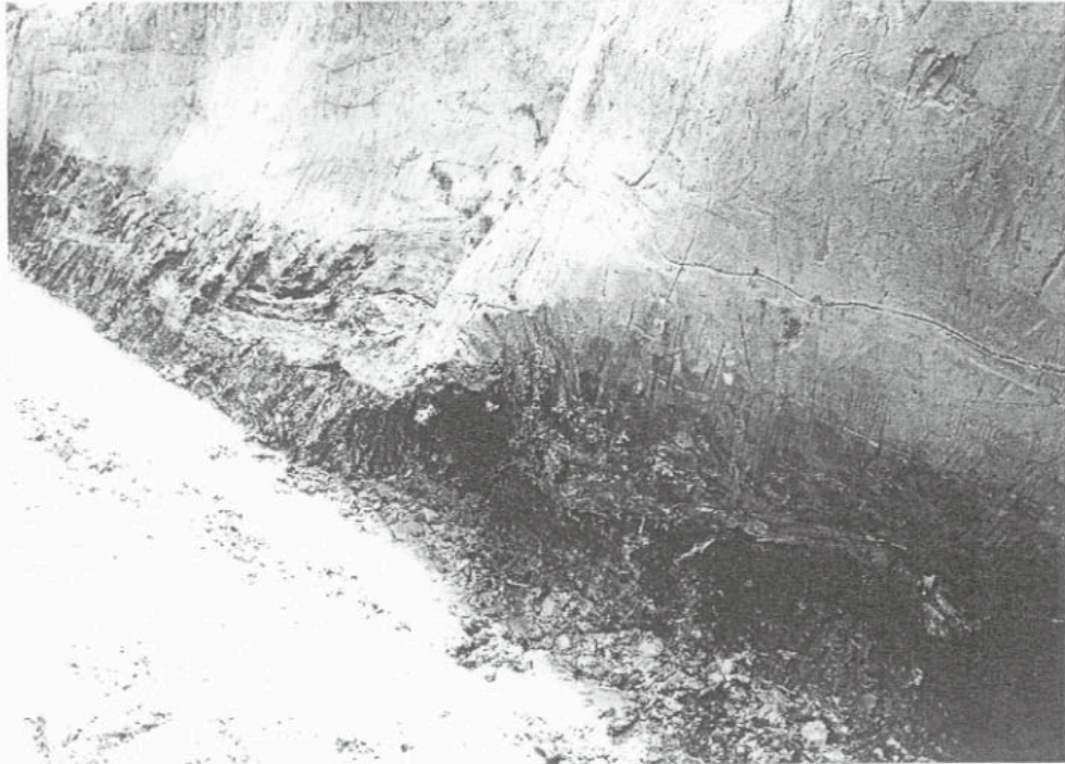
挿図写真1 山津遺跡F区の堆積層 下部の暗色部に材片と腐植を多含する。